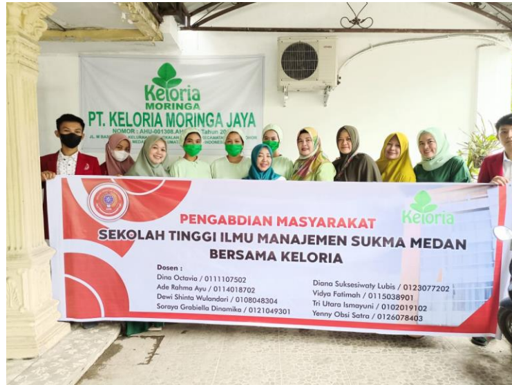
Gambar 4 : Tim Pengabdian STIM Sukma bersama Karyawan Keloria