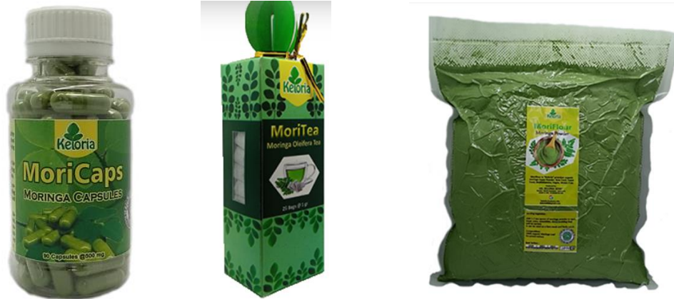
Gambar 1. Produk-produk UMKM Keloria.

UMKM Keloria ini walaupun penjualannya sudah merambah ke kancah internasional, namun sistem transaksi penjualannya masih manual. Jadi kami dari tim dosen yang berjumlah 4 orang dan dibantu dua mahasiswa ingin memberikan pelatihan mengenai pembuatan database dengan menggunakan Microsoft Access, agar manager dan karyawan dapat dengan mudah dalam menginput data penjualan, pembelian, maupun biaya-biaya yang telah digunakan. Sehingga kinerja karyawan menjadi lebih efisien.