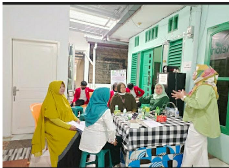
Gambar 5 : Proses pemberian pelatihan kepada karyawan Keloria