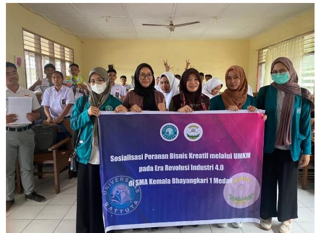
Gambar 2. Sosialisasi Peranan Bisnis Kreatif melalui UMKM pada era revolusi 4.0