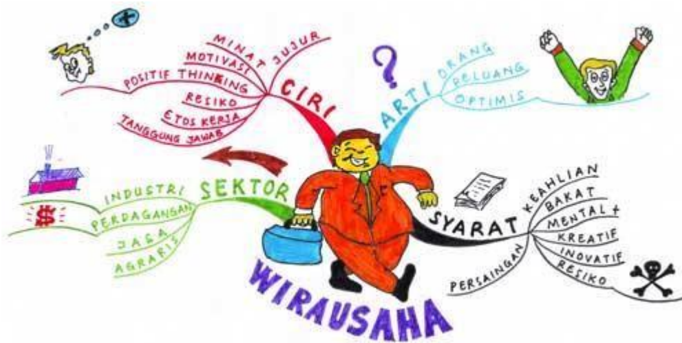
Gambar 1. Karakter Wirausaha

Persaingan di era digitalisasi ini semakin ketat, bukan hanya lulusan perguruan tinggi saja yang bersaing, melainkan juga para siswa lulusan sekolah menengah atas. Lulusan sekolah menengah atas banyak yang harus berhadapan langsung dengan pendidikan maupun dunia kerja. Pada prinsipnya Sekolah Menengah Atas (SMA) merupakan lembaga penghasil lulusan atau tenaga-tenaga yang dapat membentuk dan menyiapkan peserta didik menuju Sumber Daya Manusia (SDM) yang berkualitas, dengan demikian sudah seharusnya sekolah menyelenggarakan program-program unggulan untuk memberikan pelayanan prima bagi peserta didik.