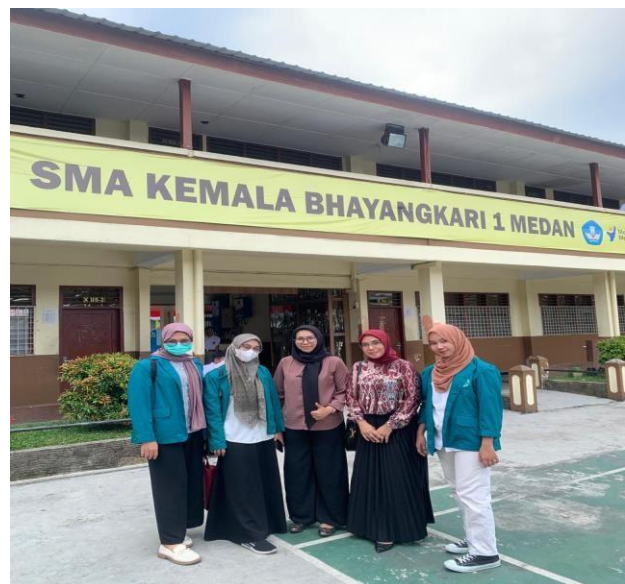
Gambar 3. Sosialisasi Motivasi Berwirausaha Di kalangan Siswa/I SMA