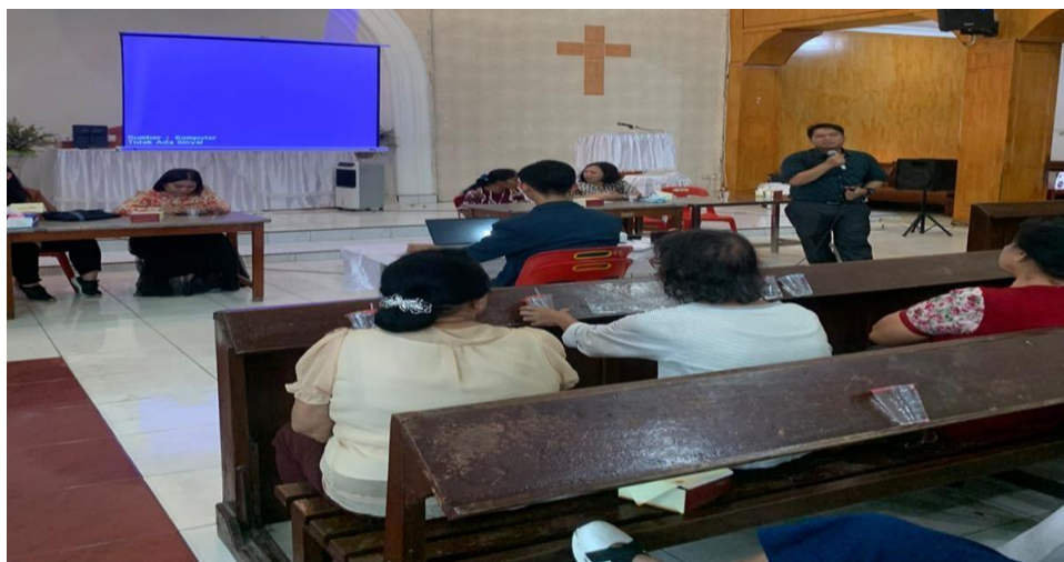
Gambar 1. Kegiatan Pelaksanaan PKM

Dari Gambar 1 merupakan kegiatan yang dilakukan di GKPI Khusus Teladan, dimana tim PKM melakukan presentase kepada para jemaat yang hadir. Dari foto ini dapat dilihat bahwa para jemaat sangat antusias mendengarkan berbagai dampak positif dan negatif yang dipaparkan oleh tim pelaksana PKM. Setelah acara selesai, tim PKM dan para jemaat melakukan foto Bersama.